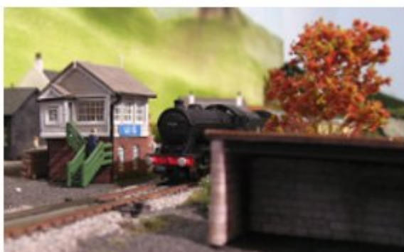
Ankunft des Parcel Trains in Uig