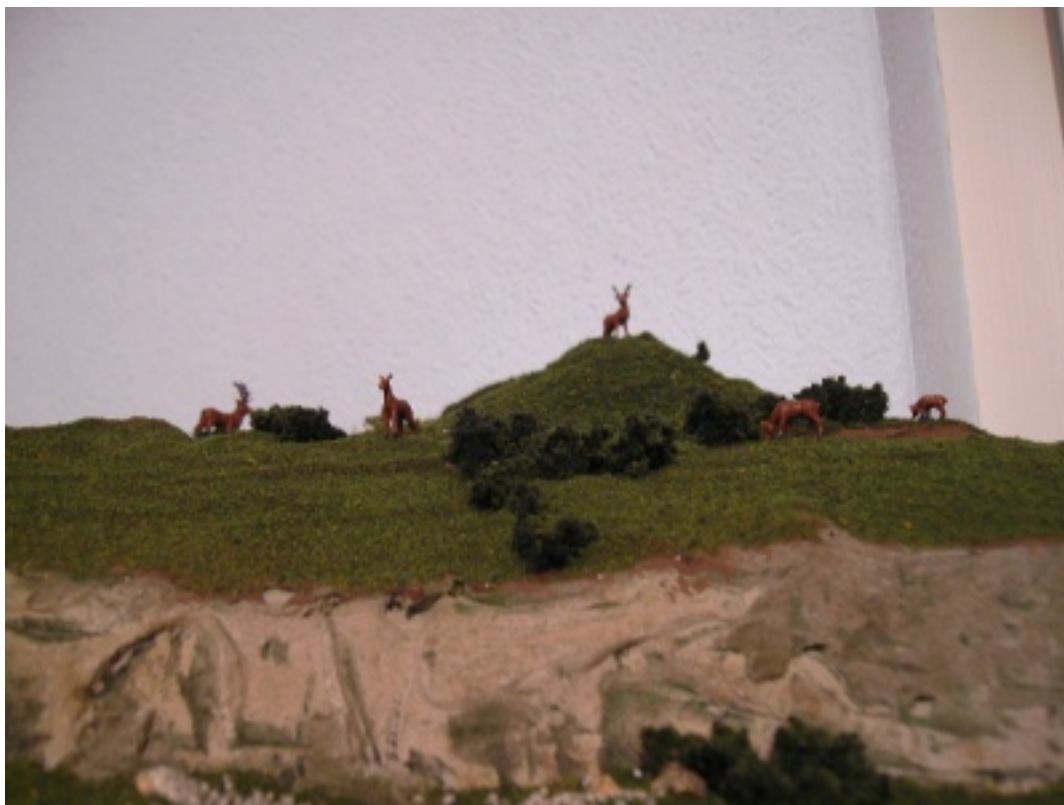
"Monarch of the Glen"